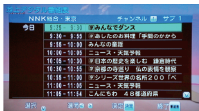
電子番組表(イメージ)

画面が小さいアナログテレビでも読みやすい1チャンネル表示方式です。見たい番組をチャンネル毎に8日分まで表示できます。