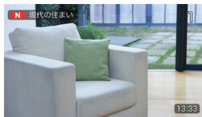
時計表示(イメージ)

画面表示ボタンを押すと現在時刻が表示されます。放送信号から時刻を取得しますので、時計あわせの操作は不要です。また、設定により画面右下に常時計を表示することもできます。