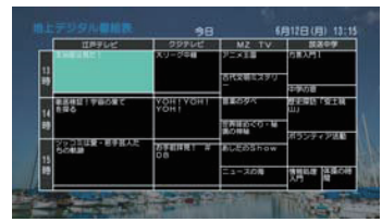
※地上・BS・110度CSデジタル放送に対応

新聞のテレビ欄のようにテレビ画面で番組表を見ることが出来ます。また、選択した番組の詳細情報を表示することも可能です。電子番組表はシンプルで軽快な操作性を実現しています。