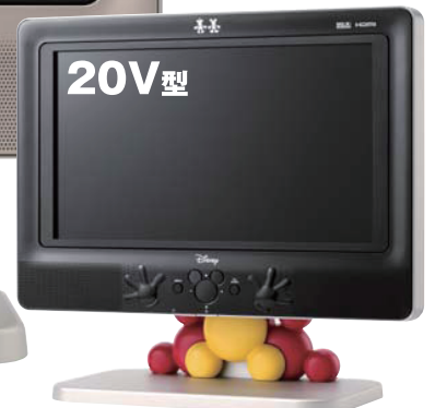
TL20DXD (B) ブラック オープン価格