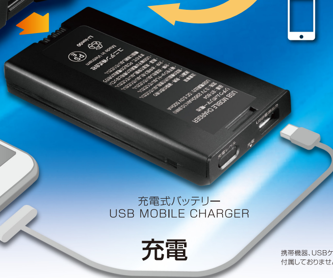
充電式バッテリー USB MOBILE CHARGER