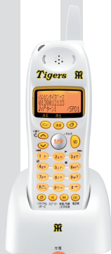
増設子機 UCT-002 (TW) HS (ホワイト)