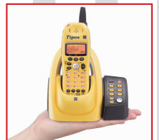
コンパクトな手のひらサイズ

デジタルならではのクリアな音質と充実した 機能、そして斬新なデザイン。 日々の生活を明るく演出します。 子機はイエロー・ホワイト・ピンクの3色から お選びください。