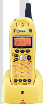
増設子機 UCT-002 (TY) HS (イエロー)