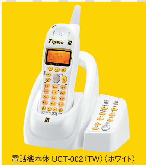
電話機本体 UCT-002 (TW) (ホワイト)