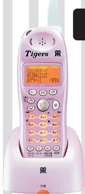
増設子機 UCT-002 (TP) HS (ピンク)