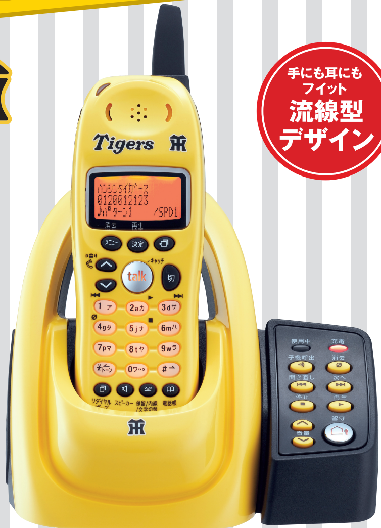
電話機本体 UCT-002 (TY) (イエロー)